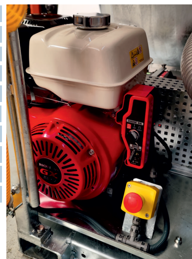
LLave arranque-paro y pulsador STOP-Emergencia